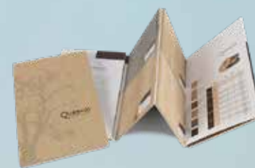
Aglutinante De Muestra Disponible