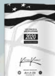
Lista De Precios