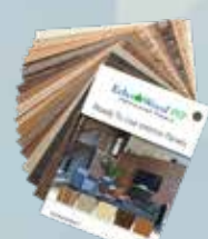
Opciones De Diseño

4 de los 16 Colores Almacenados por Rugby