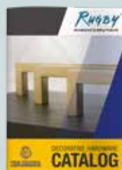
Catálogo de Herrajes Decorativos