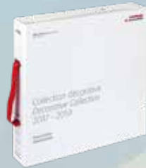
Colección Decorativa Carpeta