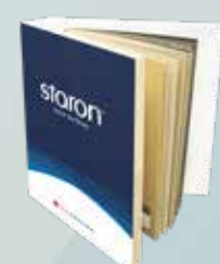
Aglutinante De Muestra Disponible