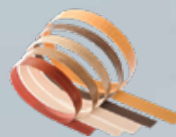
Bandas De Borde