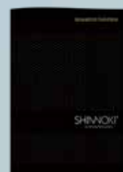
Shinnoki Acoustics Folleto