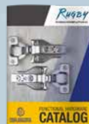
Catálogo de Herrajes Funcional

ocultas; diapositivas, que incluyen extensión de 3/4", extensión completa, montaje bajo y cierre automático suave; obturador de hardware y arandelas de escritorio.