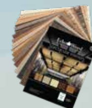
Opciones De Diseño