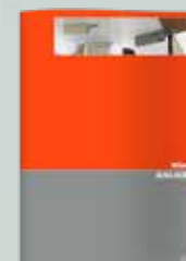
Wind Sistema de Elevación