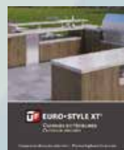
Outdoor Kitchens Folleto