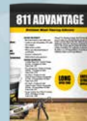
Folleto de Madera Adhesiva