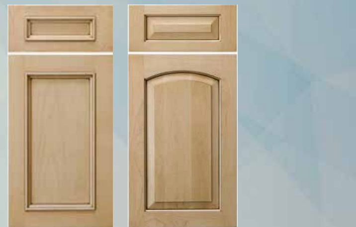
VERONA con chapada Panel central